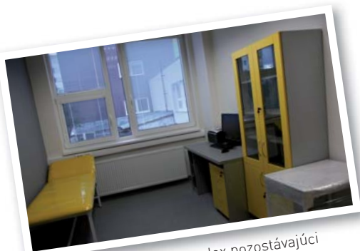
Pľúcna ambulancia. Komplex pozostávajúci z čakárne, pracovne zdravotnej sestry, ambulancie lekára, miestnosti na funkčnú diagnostiku, júl 2010.

Kým v ambulanciách prevažujú pacienti z okresov Nitra, Topoľčany a Zlaté Moravce, jednodňová očná chirurgia získava výrazný nadregionálny význam. Za ročné obdobie od jej otvorenia bolo operovaných 674 pacientov, z toho 89 % pacientov bolo z Nitrianskeho samosprávneho kraja, 8 % pacientov z Trnavského samosprávneho kraja a 3 % pacientov z ostatných krajov. Ešte výraznejšie sa prejavujú podiely jednotlivých okresov Nitrianskeho samosprávneho kraja, kde pacienti okresu Nitra tvoria 54 %, okresu Levice 40 %, okresu Topoľčany 5 % a okresu Šaľa 1 %.