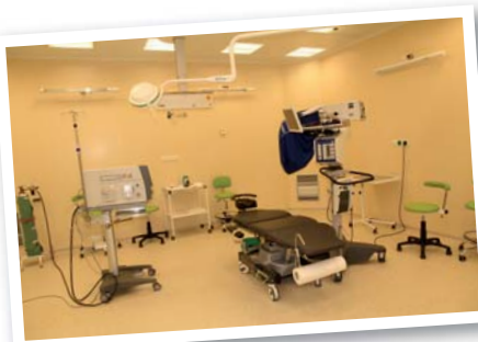
Očná operačná sála je vybavená najmodernejšou operačnou technikou.

Ďalší rozvoj zariadenia, komplexnosť ambulantných služieb previazaných na prehĺbenie kvalitatívne verifikovanej diagnostiky a školiace aktivity pri príprave lekárov sú pridanou hodnotou projektu.