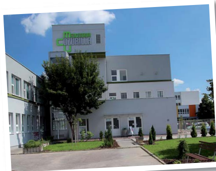
Budova Medicentra Dzurilla v Nitre

a alergológie, onkologickú, pľúcnu a očné ambulanciu. Od 1. októbra 2010 začalo činnosť Očné oddelenie svätej Otílie - špičková jednodňová očná chirurgia pod vedením bývalej dlhoročnej primárky očného oddelenia a prednostky Očnej kliniky vo FN