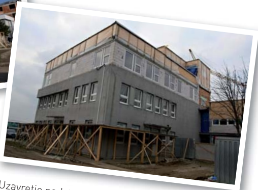
Uzavretie nadstavby, január 2010.