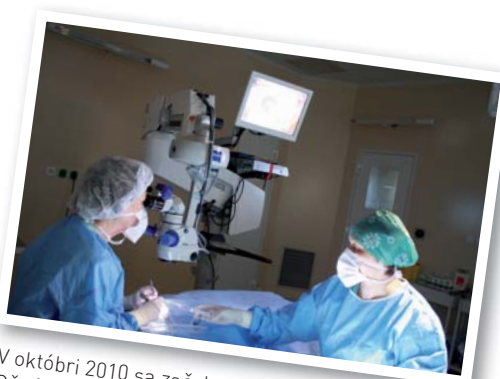
V októbri 2010 sa začal operačný program Očného oddelenia svätej Otílie.