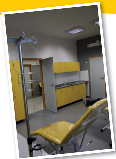
Miestnosť na podávanie cytostatickej liečby, onkológia, júl 2010.